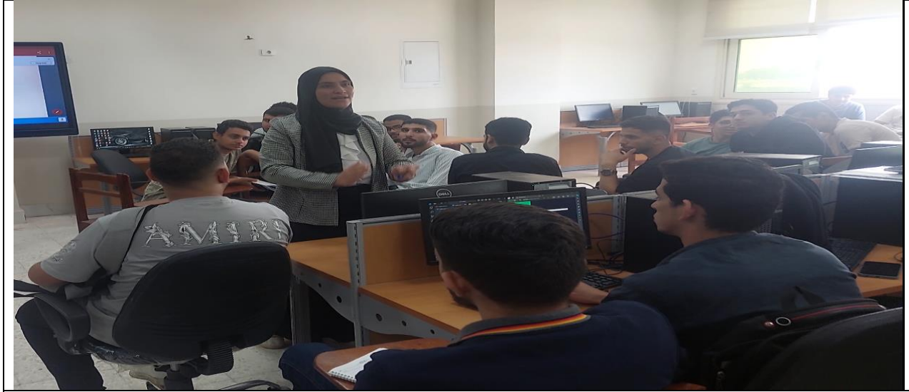
5- صور تطبيق خطه الاخلاء للطلاب والموظفين